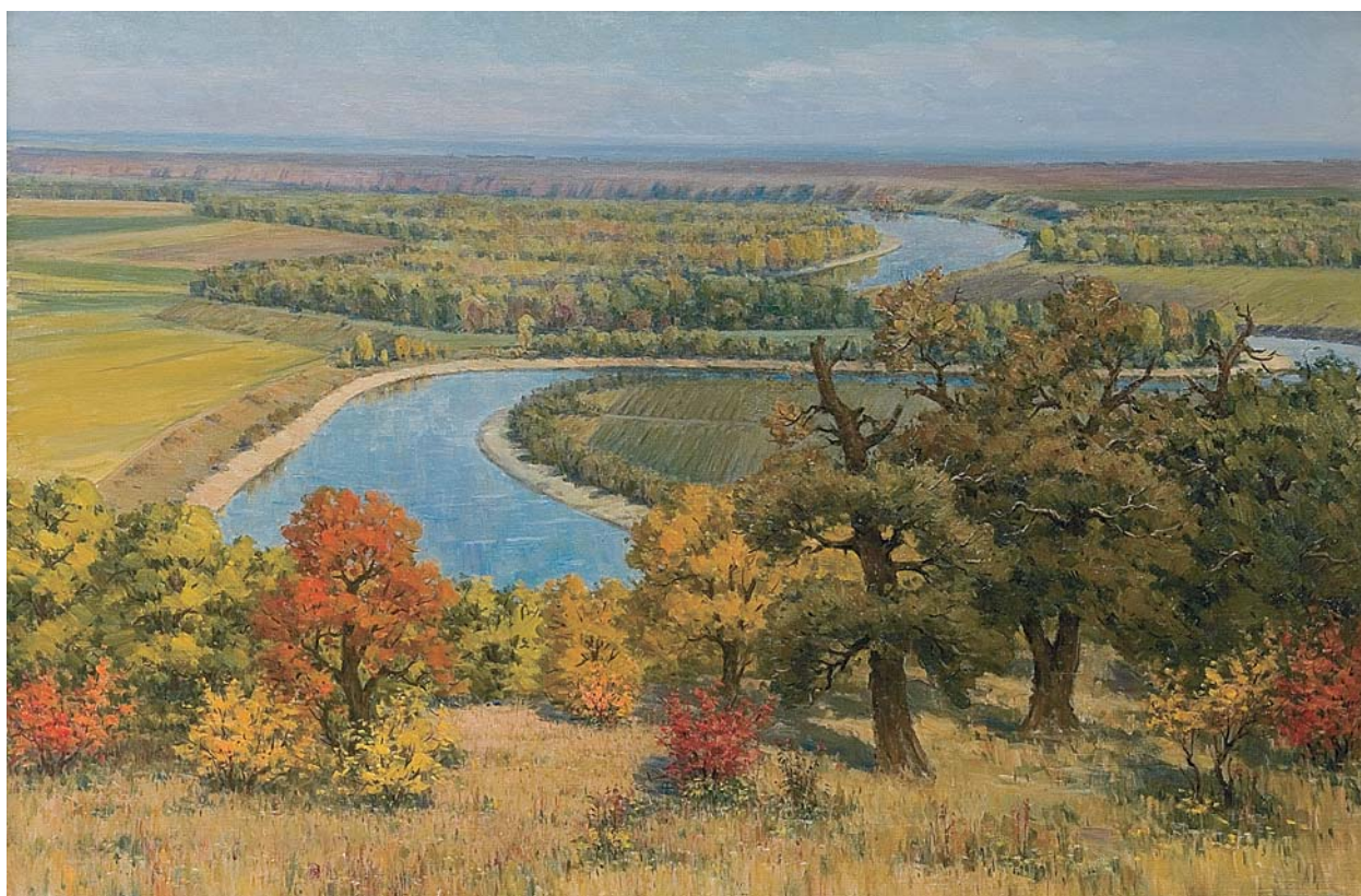
Mihail Petric. Nistrul lângă Speia , u/p, 100 x 150 cm, 1958. Din colecțiile MNAM

Tocmai din aceste considerente și având în vedere că alterarea și falsificarea adevărului în abordarea trecutului istoric transcende perioada regimului totalitar comunist, astăzi, mai actual ca oricând, este necesar un efort permanent al istoricilor de reconstituire a trecutului nostru istoric în acord cu unicul criteriu valabil, cel al adevărului. Din acest punct de vedere, volumul istoricului Ion Șișcanu reprezintă un veritabil model de urmat al pledoariei constante în favoarea cunoașterii și asumării nealterate și integrale a trecutului. În urma unor investigații de amploare și a sintetizării celor mai recente cercetări istorice, lucrarea aduce noi contribuții și interpretări în legătură cu problemele esențiale ale istoriei naționale și celei universale, justificând astfel convingerea că volumul în cauză va fi recepționat cu real interes nu numai de către specialiștii în domeniu, ci și de către toți cei pasionați de problematica istoriei contemporane.